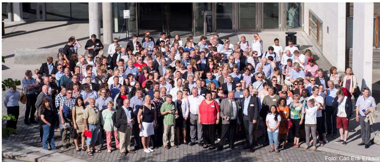
Politikerne i Trondheimsregionen på besøk til NTNU og SINTEF.

Styrke Trondheimsregionens utvikling i en nasjonal og internasjonal konkurransesituasjon og å ivareta en positiv utvikling av deltakerkommunene, i samspill med Trøndelag og Midt-Norge.