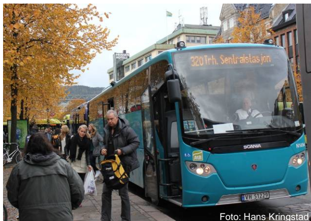
Regionale busser – en suksesshistorie

Budsjett for ledelse/sekretariat/samarbeid i 2017: 1,0 mill kr.