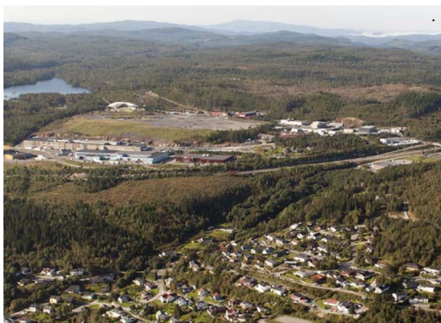
Sveberg i Malvik

Trondheimsregionen er politisk referansegruppe for samferdselsprosjekt i byregionen. Trondheimsregionen bidrar aktivt i påvirkningsprosesser mot sentrale organ.