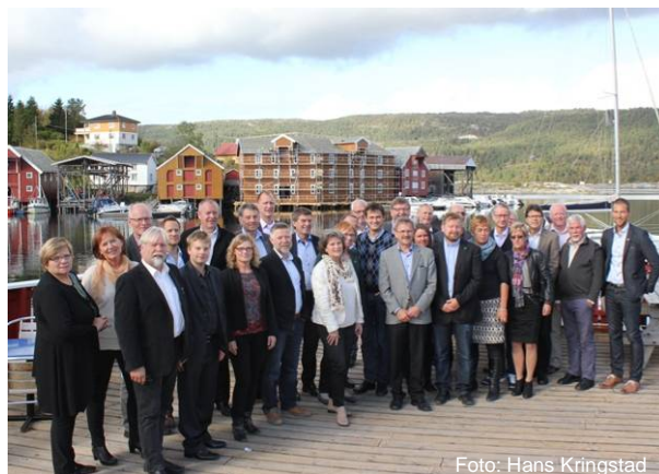
Trondheimsregionen-regionrådet i Råkvåg.