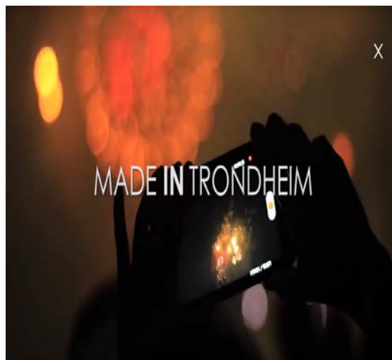
Film om mikrochip-miljøet.

Budsjett for profilering/kommunikasjon/påvirkning i 2017: 2,5 mill kr.